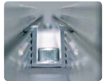
Tecnica di fissaggio innovativa; morsetto innoframe