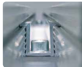
Tecnica di fissaggio innovativa; morsetto innoframe