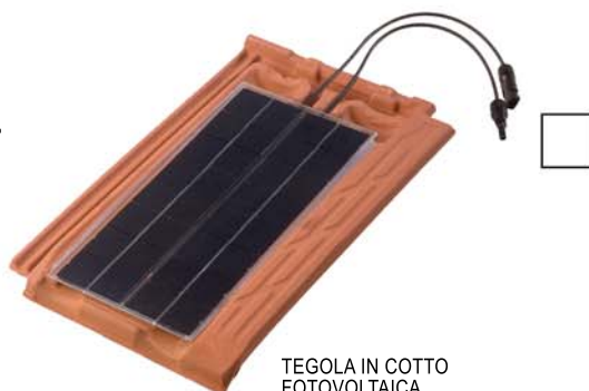
TEGOLA IN COTTO FOTOVOLTAICA