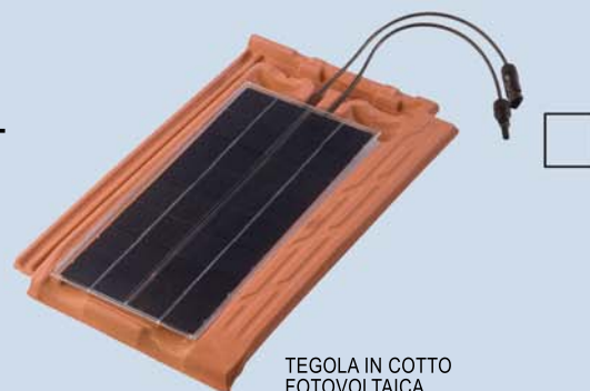
TEGOLA IN COTTO FOTOVOLTAICA