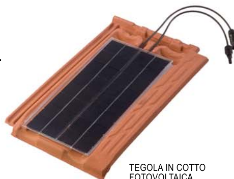
TEGOLA IN COTTO FOTOVOLTAICA